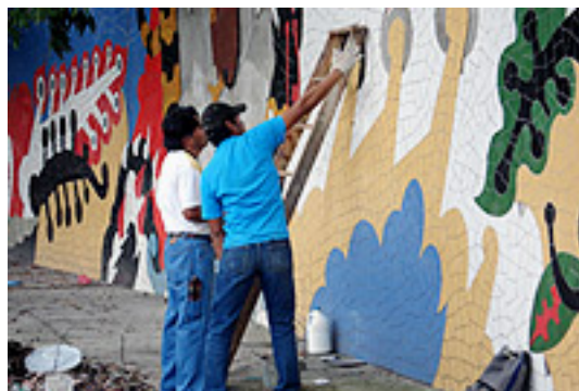
Colocando el azulejo del Mural "Bestiario"

El Mosaico Mural: “Serpiente y Acueducto” fue inaugurado por el Alcalde Álvaro Arzú, el 17 de enero de 2007.