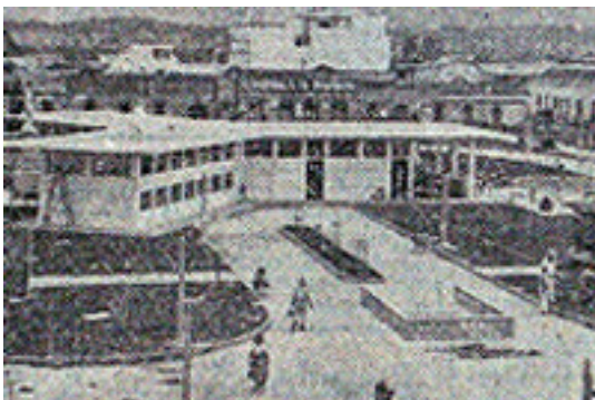
Vista de la primera Biblioteca Infantil "Cristobal Colón" .

Complementos que embellecen los 117 arbolitos que han sido sembrados en el piso engramado y distribuidos en las distintas partes del parque. Además, en la parte exterior de la pista han sido colocadas 50 bancas, con capacidad de cuatro personas cada una, para brindar comodidad a los visitantes. Finalmente cuando la empresa eléctrica logre conseguir los materiales que faltan, la iluminación que darán 60 postes de metal, simétricamente distribuidos y con conexión subterránea, será sencillamente espléndida.