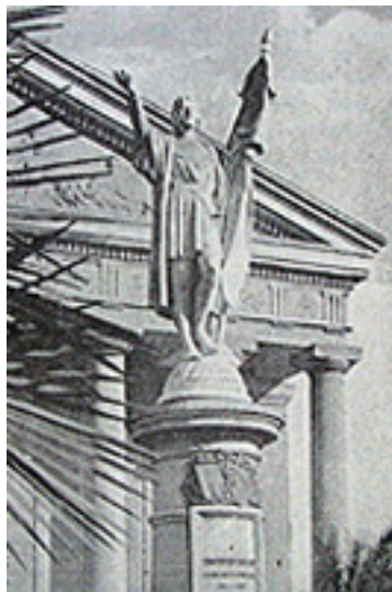
Monumento a Cristobal Colón, descubridor de América.